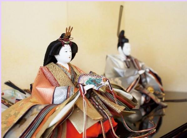
【画像協力：桂甫作 安藤人形店】

この度、＜日本の年中行事の歴史的背景を学び、五節句文化に関する見識を深める＞目的で、会員の皆様向けに、「GCA茶論（サロン）」と銘打った研修会を開設することになりました。記念すべき第1回を、下記の通り開催いたしますので、どうぞご参加ください。